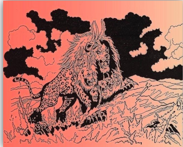
Afbeelding Jos Vanspauwen: Uitgeverij Pieters

Nadat het koningschap van Christus werd geproclameerd (11:15) en de draak, de oude slang, die genoemd wordt “de duivel”, op de aarde werd geworpen (12:9), zien wij in hoofdstuk 13 uit de volken (zee) een grote politieke wereldmacht opkomen. Deze enorme wereldmacht heeft een leider. De Bijbel noemt hem “de antichrist”, wat betekent: tegenstander van Christus. De duivel zal hem, nadat hij uit de hemel is geworpen, zijn kracht, troon en grote macht geven (vers 2).